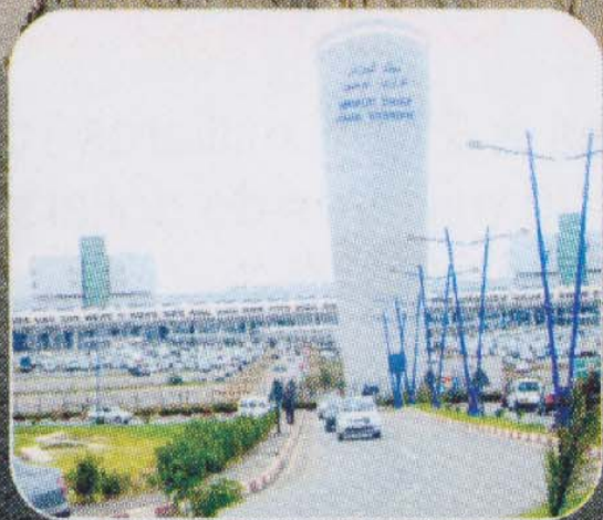
Aéroport international d'Alger